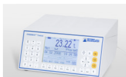
Eichfähige Auswägevorrichtung mit Drucker oder Eichspeicher