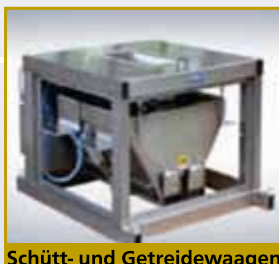
Schütt- und Getreidewaagen