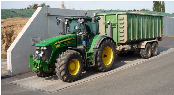
Abb. 1 BITZER Komplettfahrzeugwaage

Auf der diesjährigen EuroTier vom 11. bis 14. November 2014 in Hannover präsentiert die BITZER Wiegetechnik GmbH aus Hildesheim in Halle 21, Stand C18, ihr umfangreiches Waagen- und Softwareprogramm für die Bereiche Agrar und Bioenergie.