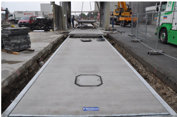
Abb. 2 Einbau einer 36m BITZER Verladewaage

Die Firma BITZER Wiegetechnik GmbH verfügt über eine breite Produktpalette an Waagen, Softwareprogrammen und Sonderlösungen. Neben den Standardmaßen für Fahrzeugwaagen von 8 m bis 20 m sind auch Waagen mit einer Brückenlänge von bis zu 40 m und mehr erhältlich. Weitere Sondermaße in der Breite sind ebenso auf Kundenwunsch realisierbar. Alle Waagen sind aus hochwertigem Beton (Güte C 45/55) gefertigt und mit verschleißfreien Ringtorsions-Wägezellen ausgestattet.