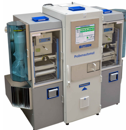
Abb. 5 BITZER Probenautomat mit zweiter Besatzlinie

ermittelten Qualitätswerte von handelsüblichen Ganzkornbestimmern übernimmt und die Werte gemeinsam mit den Wiegeergebnissen in eine Datenbank schreibt. Durch das patentierte Verfahren wird der Analyseprozess schneller, transparenter und weniger fehleranfällig.