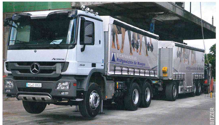
Ein Eichfahrzeug kommt als Prüfgewicht für Waagen zum Einsatz.

schaftliche Waagen eine wichtige Rolle. Im Bereich der an Waagen angebotenen Software gibt es Lösungen zur Automatisierung von Wiege- und Datenverarbeitungsvorgängen, die neben vereinfachten Prozessen auch eine Zeitersparnis mit sich bringen. Die Softwarelösung „Bitzer Professional“ des Unternehmens Bitzer Wiegetechnik bietet solch eine Lösung an. Die für verschiedene Branchen konfigurierbare Software vereinfacht und beschleunigt die Bedienung und Informationsverarbeitung von beispielsweise Fahrzeugwaagen durch vielfältige Funktionen wie die Selbstverwiegung durch die Fahrer oder eine automatisierte Wiegescheinerstellung.