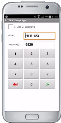
Eingabe des KFZ Kennzeichens und Auslösung der Wiegung

Mittels der BITZER Waage App für Android Handys ist eine bedienerfreundliche Auslösung der Wiegung vom mobilen Gerät möglich. Gleichzeitig empfängt das Smartphone den Lieferschein, der so in elektronischer Form zur Weiterverarbeitung zur Verfügung steht.