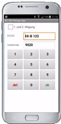
Eingabe des KFZ Kennzeichens und Auslösung der Wiegung

Mittels der BITZER Waage App für Android Handys ist eine bedienerfreundliche Auslösung der Wiegung vom mobilen Gerät möglich. Gleichzeitig empfängt das Smartphone den Lieferschein, der so in elektronischer Form zur Weiterverarbeitung zur Verfügung steht.