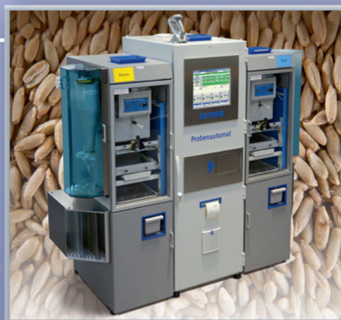
Probenautomat mit zweiter Besatzlinie

Mehr Informationen unter www.bitzer-waage.de Einfach QR-Code scannen →