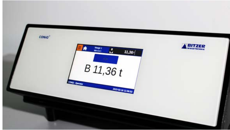
Wiegeelektronik Coniq Control